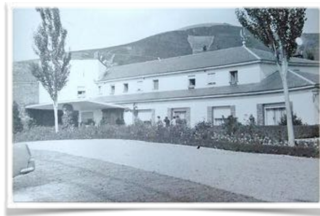
5001 Detalle de la fachada delantera desde el aparcamiento antes de la reforma de 1975