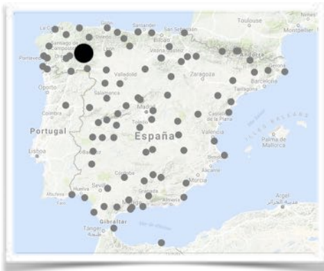
1003 Villafranca del Bierzo en España