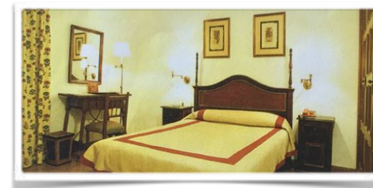
4001 Aspecto de la antigua habitación 112