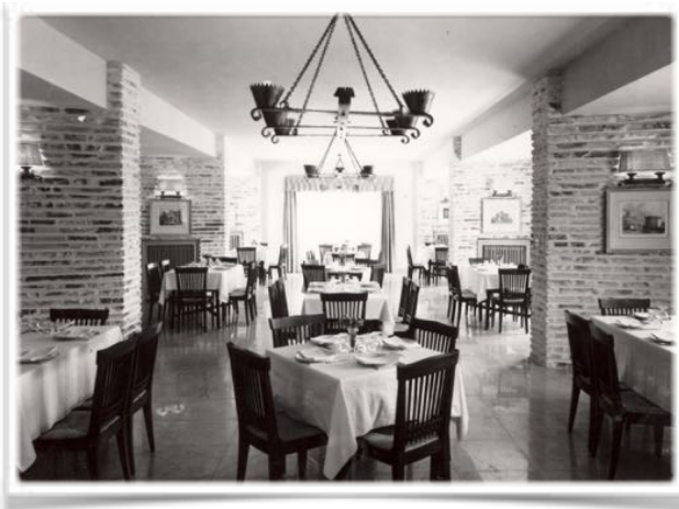
4001 Vista del amplio restaurante antes de la reforma de 2009