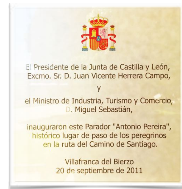
1001 Detalle de la placa de la segunda reinauguración