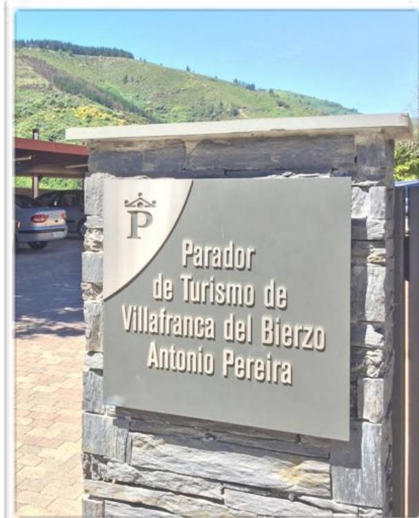
1001 Acceso al parador desde la carretera N-VI