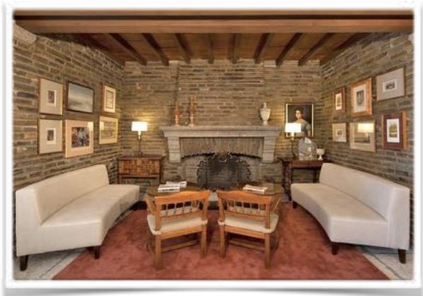
1001 El salón-chimenea en junio de 2016