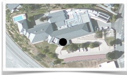
1007 Vista desde satélite del parador