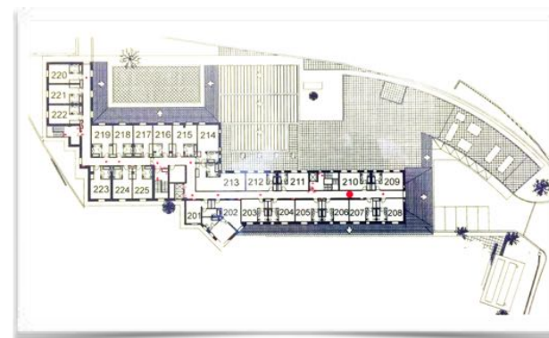
1001 Plano de la segunda planta actual