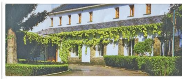
4001 Ambas imágenes muestran la frondosa hiedra delantera, conocida en toda la Red.