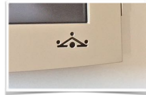
1001 Recubrimiento personalizado del televisor de la estándar 104