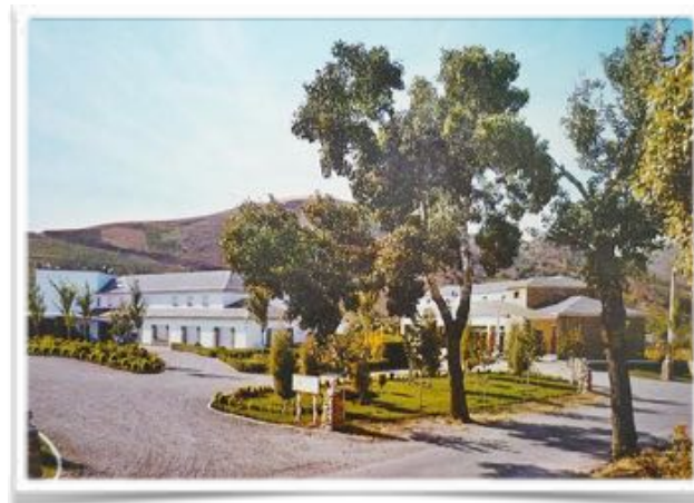
5012 Instalaciones del albergue de carretera: a la derecha, la estación de servicio con gasolinera, garajes y taller mecánico.