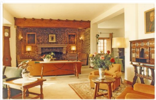
4000 El salón-chimenea en una imagen retrospectiva