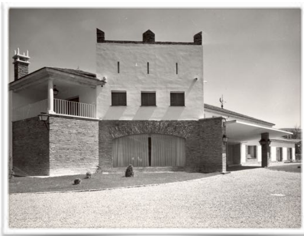
4001 El torreón principal con el antiguo balcón