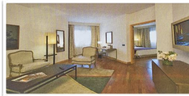
4010 La espaciosa y moderna suite 102 que ocupa el torreón