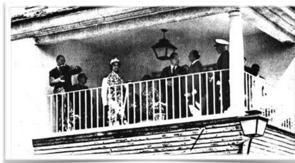
3001 El general Franco (segundo a la izquierda de la columna) y su esposa Carmen Polo (vestida de blanco) en la visita de septiembre de 1959