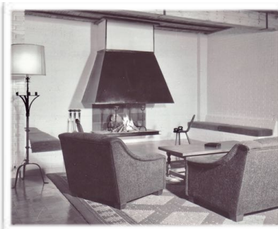
4001 El arquitecto Manzano-Monís previó todos los detalles decorativos