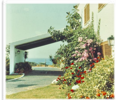
4001 Líneas puras en la marquesina de acceso. Al fondo, el Atlántico.