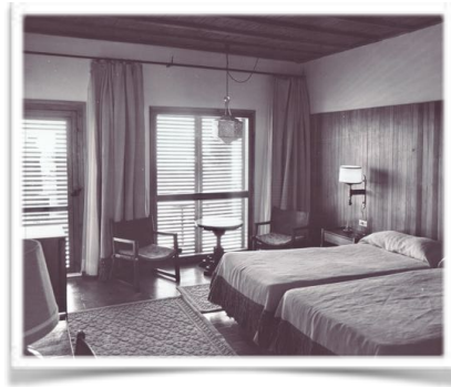
4001 En las habitaciones 1 a 10 ésta fue la primera decoración