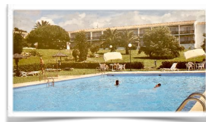
2001 El pabellón sur , creado en 1989 , en sus primeros años.

El seis de marzo de 1988 se publican las primeras noticias de la gran ampliación de 1989 que elevó a cuatro estrellas la categoría oficial y casi duplicó la capacidad (pasa a 43 habitaciones y 86 plazas) con la construcción de un pabellón sur de veinte dobles y una suite . Asimismo, a las zonas comunes se les dotó de más iluminación natural y artificial y se renovaron completamente las instalaciones en las salas de máquinas de producción de calor y frío, lavandería, centro de transformación eléctrica y también la implantación de una depuradora de aguas residuales.