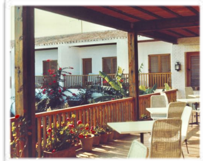
4001 Al fondo, de derecha a izquierda, imagen retrospectiva de las habitaciones 11, 12 y 13 desde la galería superior