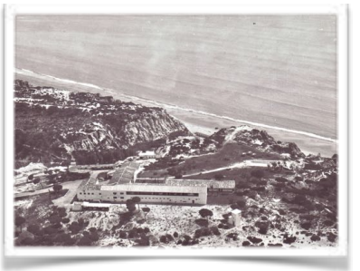
4001 Hasta la reforma de 1989 éste era el aspecto global del recinto desde el norte