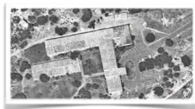
1073 Vuelo sobre el parador de Moguer en 1973

En sus primeros años de andadura la capacidad hotelera se compuso de diecinueve habitaciones dobles y una individual que pronto se vieron insuficientes, lo que ha determinado una constante evolución que ha llevado al parador por sucesivas reformas y ampliaciones hasta la configuración actual de 63 estancias para hasta 126 huéspedes que en el presente se divide en treinta y dos estándares (dos con cama de matrimonio); dieciocho su-