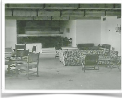
9101 Salón de clientes en octubre de 1968