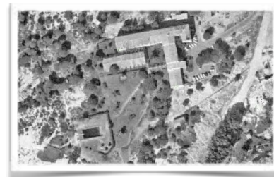
1080 Vuelo sobre el parador de Moguer en 1980

Ya el 17 de junio de 1972 se anunció la primera ampliación que propuso el ambicioso propósito de alcanzar hasta ciento veinte plazas hoteleras, pero los trabajos tuvieron que esperar hasta acabadas las fiestas de año nuevo de 1979, y cuyas obras se prolongaron hasta el mes de mayo de 1980, sin llegar al techo deseado.