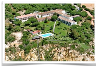
5010 Vista aérea desde el sur tomada por un dron en 2018