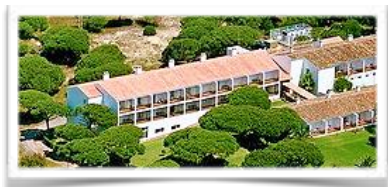
5010 Vista aérea desde el sur del nuevo pabellón oeste añadido en 2002