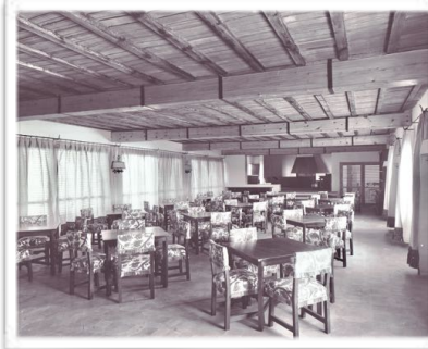
4001 Restaurante principal del parador, hoy Marmítica .