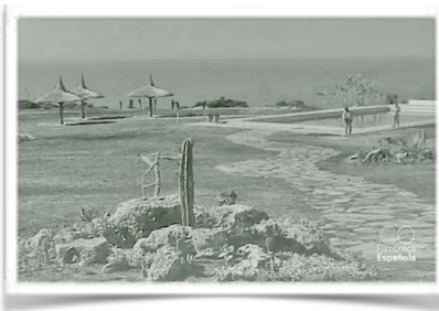
9101 La piscina a estrenar. Octubre de 1968 . Junto a ella dos empleados del parador.