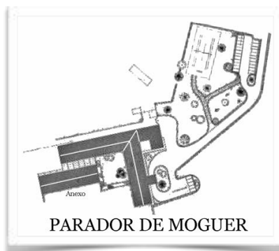
4014 Estructura del proyecto original del parador de Moguer en 1968