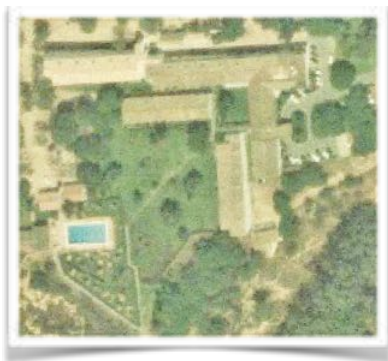
1098 Primera imagen aérea del parador de Moguer tras la ampliación de 2002 . En tejado de tono más claro, el nuevo pabellón.

Durante la década siguiente se produjeron importantes aumentos en la demanda que conminaron al gobierno central a anunciar el primero de febrero de 2000 que en los Presupuestos Generales del Estado habría consignados ciento veinte millones de pesetas para dotar al parador de Mazagón de un importante espaldarazo que se formalizó con creces al año siguiente al fijar el 19 de mayo de 2001 en doscientos setenta y cinco millones de pesetas la reforma integral , ampliación con un nuevo pabellón hacia el oeste y redecoración, culminados en 2002 , que ha llevado al parador hasta su configuración presente.