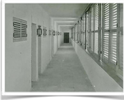
9101 Flamante pasillo (habitaciones 11 a 20) en la primera semana tras la inauguración .