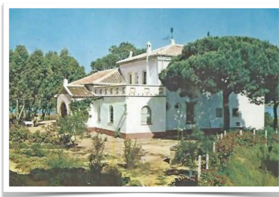
5043 Uno de los más bellos paradores, fue la hostería de La Rábida .

Sólo seis más, finalmente, continúan como hoteles de titularidad pública con concesión privada en la gestión (Áliva, El Aaiún, Juanar, Puerto del Rosario, Puertomarín y Santa María de la Cabeza) o completamente privada (La Bañeza, Lequeitio y Villacastín). El de Juanar, por desgracia, tras varios periodos de actividad, se encuentra clausurado.