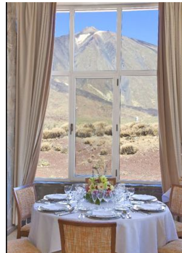
Las Cañadas , la mesa más alta de la Red; Benicarló , la piscina más baja.

98 653 Parador de Zamora Condes de Alba y Aliste 41.50241371176167,-5.747999535582039