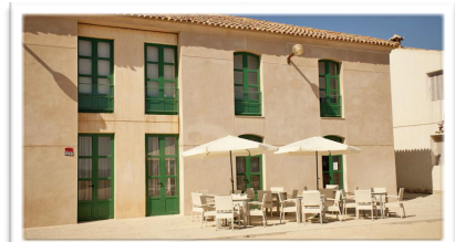
6001 Terraza de la cafetería