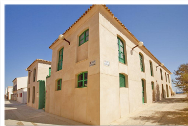
6001 Exterior del hotel