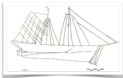
5007 Uno de los grafiti extraídos de los muros