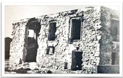
5007 Estado de ruina anterior a la rehabilitación