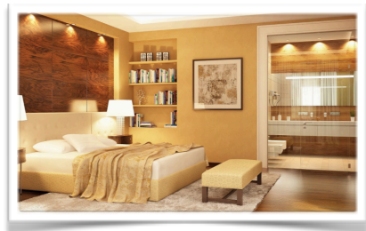
5005 Interior de la suite iunior